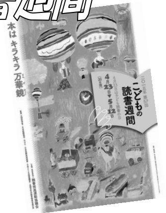
第57回「こどもの読書週間」標語