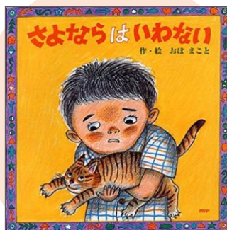
『さよならはいわない』 おぼ まこと // 著

たくさん遊んで仲良くなったジャッキーとケイティ。ケイティが熱を出してケイティの好きなお花で元気にさせたい！でも、きのうまでであった、そのお花が今日は無い!?どうする、ジャッキー!?かわいいジャッキーのお話です。 (M・Mさん)