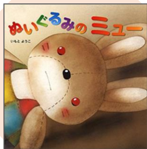
『ぬいぐるみのミュウ』 いもと ようこ // 著

まみちゃんとミュウはいつもいっしょだった。ある日、まみちゃんは大切なぬいぐるみのミュウを落としてしまい、ぬいぐるみのミュウは大声で叫んだがまみちゃんは気付かず行ってしまった。果たして、ぬいぐるみのミュウはこれからどうするのだろうか！ (Y・Mさん)