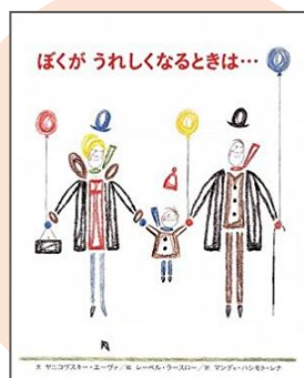
『ぼくがうれしくなるときは...』 ヤニコブスキー・エーヴァ // 著

ある日、僕あてにおじいちゃんが電話をかけてきた。僕は急におじいちゃんに会いたくなって、こっちに来ないかと言われ、僕はおじいちゃんの所に行って、その時おじいちゃんが亡くなって、僕はおじいちゃんからもらった言葉を心にしまっていくお話です。 (Y・Mさん)