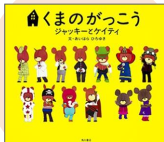
『くまのがっこう ジャッキーとケイティ』 あいはら ひろゆき // 著

まみちゃんとミュウはいつもいっしょだった。ある日、まみちゃんは大切なぬいぐるみのミュウを落としてしまい、ぬいぐるみのミュウは大声で叫んだがまみちゃんは気付かず行ってしまった。果たして、ぬいぐるみのミュウはこれからどうするのだろうか！ (Y・Mさん)