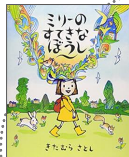
2010年 課題図書 『ミリーのすてきなぼうし』 きたむら さとし // 著

お気に入りの帽子がほしいミリーですが、お金を持っていません。でもミリーは、とびきり素敵な帽子を手に入れました。ミリーだけの特別な帽子! その帽子とは…。